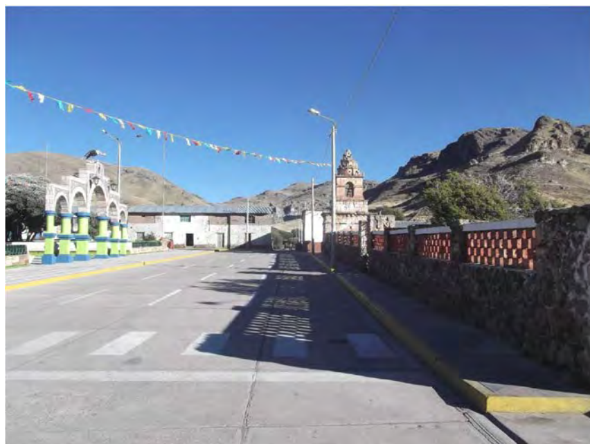
Fotografía tomada del yacimiento minero desde la Comunidad Urbana de Huacullani, 20 de julio de 2015. El yacimiento se localiza tras las viviendas que aparecen entre el arco y la torre de la iglesia de la ciudad 41

48. El yacimiento minero Santa Ana puede ser visitado con facilidad desde la Comunidad Urbana de Huacullani siempre que se cuente con el permiso y apoyo de comuneros del lugar. En mi visita al lugar pude verificar la cercanía del yacimiento al distrito de Huacullani y al distrito de Kelluyo.