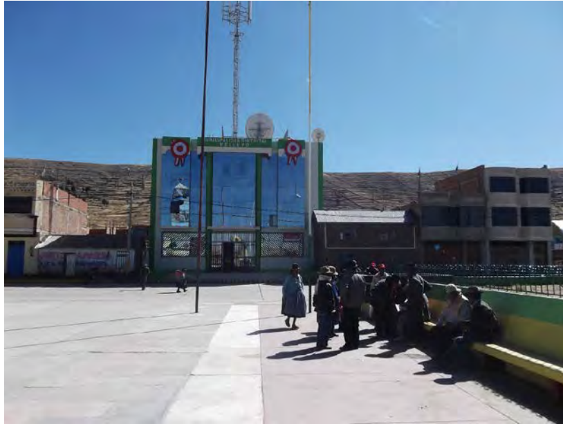
Fotografía desde Comunidad Urbana de Kelluyo. El yacimiento minero se encuentra detrás de la montaña que aparece tras las viviendas y el local municipal. 21 de julio de 2015.

49. El yacimiento minero de Santa Ana no era importante para los comuneros residentes en las Comunidades Campesinas o Parcialidades del Distrito de Huacullani, y menos en las Comunidades y Parcialidades de Kelluyo, sino hasta inicios de la primera década del año 2000. 42 Para los comuneros que han vivido con posterioridad a la reforma agraria de 1968 en que se reconstituyeron sus territorios comunales, solo conocían que sus tierras eran importantes y necesarias para actividades agrícolas y ganaderas que han practicado históricamente. En 1996 el área del yacimiento minero había sido declarada Zona Reservada Aymara Lupaca, a través del Decreto Supremo Nro. 002-96-AG. 43 A través del citado Decreto Supremo se creó esta inicial área natural protegida (por su flora y fauna silvestre, su belleza paisajística y sus recursos naturales) que tuvo 300,000 hectáreas, comprendiendo las provincias de Chucuito y Yunguyo, en las que se encontraba el yacimiento minero Santa Ana y los distritos de Huacullani y Kelluyo.